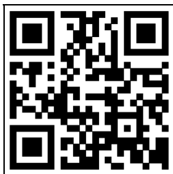
学生心理健康教育中心 (门户网站)